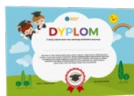
Klasa I-III Zakończenie roku szkolnego