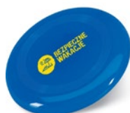
Latający dysk 15 zł