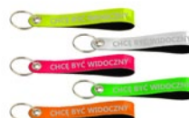
Zawieszka odblaskowa 3,99 zł