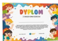
Klasa I-III Dzień Dziecka

Przygotowane z myślą o Dniu Dziecka lub z okazji zakończenia roku szkolnego i rozpoczęcia wakacji. Dyplomy przygotowane są dla dwóch grup wiekowych (klasy I-III oraz IV-VIII).