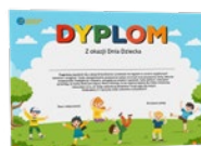
Klasa IV-VIII Dzień Dziecka