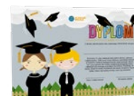
Klasa IV-VIII Zakończenie roku szkolnego