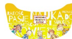
Daszek przeciwsłoneczny 3 zł